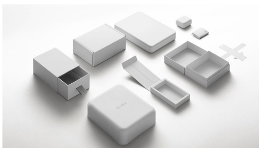
オリジナルブレンドマテリアルのパッケージ (イメージ)

「オリジナルブレンドマテリアル」は、ソニー製品のパッケージにおける素材循環を実現することを目的に開発された紙素材です。産地を特定した竹、さとうきびの搾りかす、リサイクルペーパーが原料で、さまざまなソニー製品の外箱、内箱で採用されているほか、ソニーグループ各社の名刺素材としても利用されるなど、その用途が拡大しています。