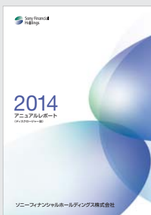
アニュアルレポート (ディスクロージャー誌)

「データ集」は、SFHホームページのみの開示とさせていただきます。 なお、本編は、SFHホームページにも開示しております。